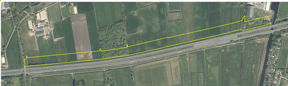
Luchtfoto van de locatie

Op ongeveer 400 meter van Oostwold loopt de A7. Deze rijksweg is in het dorp goed hoorbaar. Het is een lang gekoesterde wens om een geluidswal langs de A7 te realiseren. Vanuit de bewoners van het dorp is het idee ontstaan om de geluidswal te realiseren die direct ook dient voor zonne-energieopwekking. Ook loopt een fiets- en ruiterspad over de wal. De wal wordt aangekleed met inheemse planten en bomen en een boomgaard met fruitbomen. De wal wordt 1,55 kilometer lang, 10 meter hoog en 60 meter breed. De grondwal wordt opgebouwd uit licht verontreinigde grond.